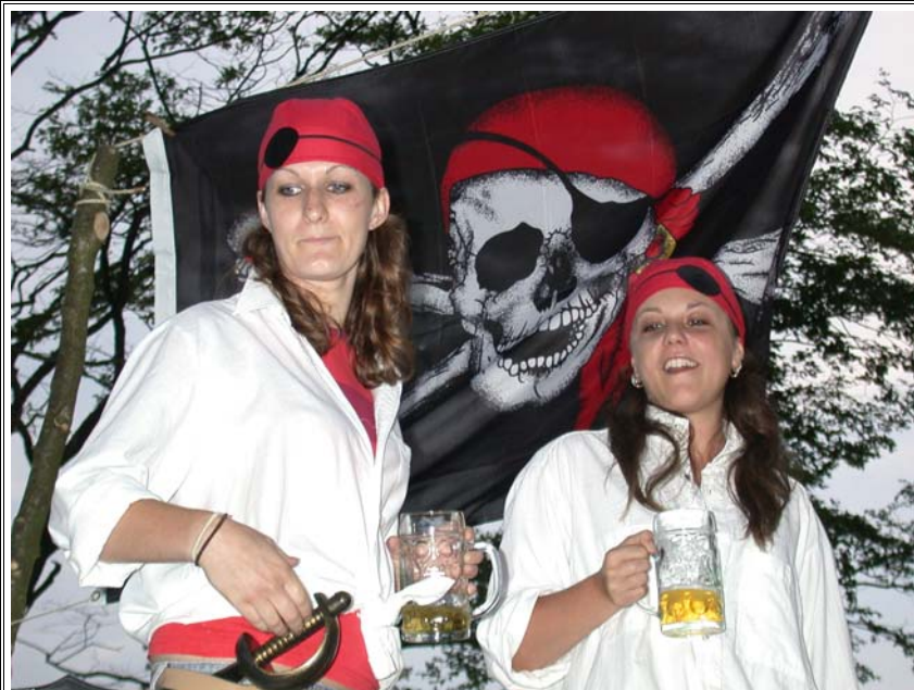
Käpt'n und Steuermann des Piratenschiffs

lignen Teamerinnen und Teamer präsentierten von Harry, vorbei. Bei der Kinderbetreuung einem neu erbauten Piratenschiff wurden die Camp Bewohner von der Be-