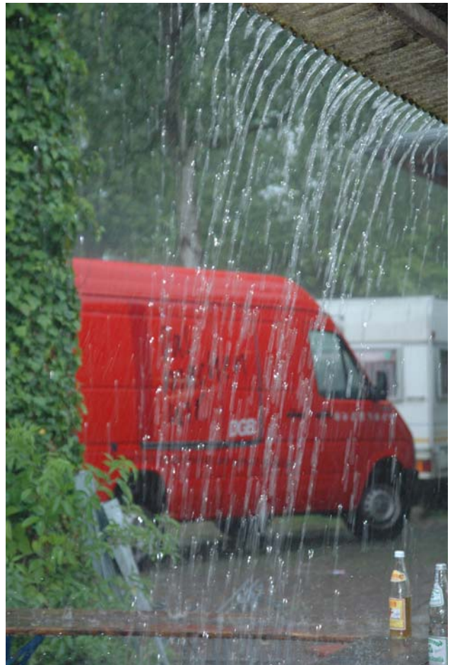
Das kurze, aber heftige Gewitter brachte viel Wasser, wie dieses Bild eindrücklich zeigt.