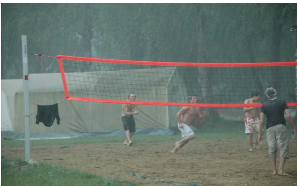
Die engagierten Volleyballspieler liessen sich trotz des plötzlich einsetzenden Regens nicht von ihren Spiel abhalten, junge Metaller eben .....